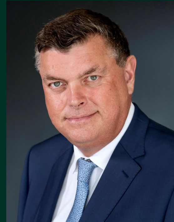
Mogens Jensen (S)

Minister for fødevarer, fiskeri og ligestilling samt minister for nordisk samarbejde